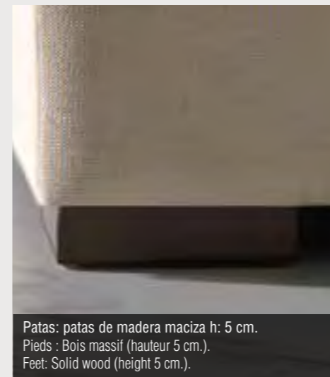
Patas: patas de madera maciza h: 5 cm. Pieds : Bois massif (hauteur 5 cm.). Feet: Solid wood (height 5 cm.).

Estructura: Estructura de madera maciza y tablero contrachapado acolchado con espuma de poliuretano de diferentes densidades.