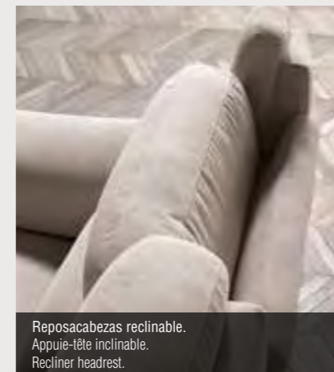
Reposacabezas reclina- ble. Appuie-tête inclinable. Recliner headrest.

Frame: Pine solid wood and plywood board covered by polyurethane different densities.